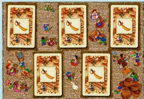
Un marché avec cinq cartes identiques.