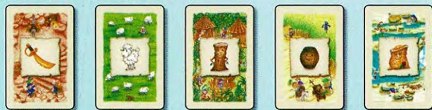
Sabre Laine Bois Rhum Or