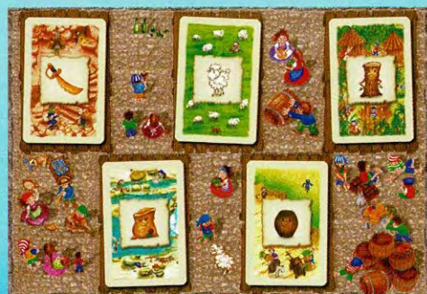
Cinq nouvelles cartes (une de chaque type) sont placées.