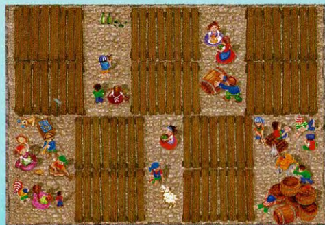
Toutes les cartes retournent dans la réserve.