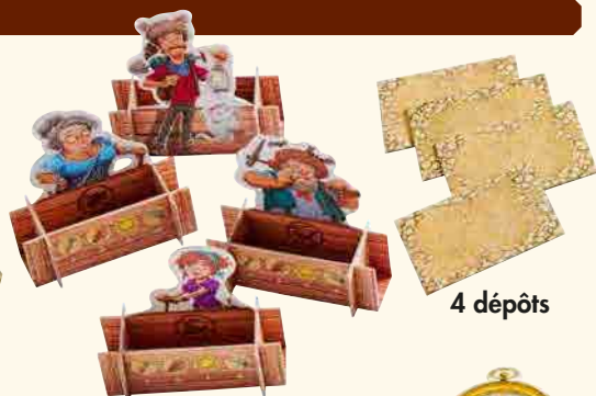
4 personnages avec coffre

(partie inférieure de la boîte avec double fond pour l'effet d'explosion)