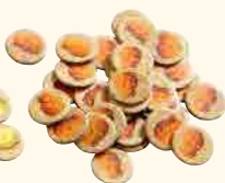
35 pépites d'or illicites